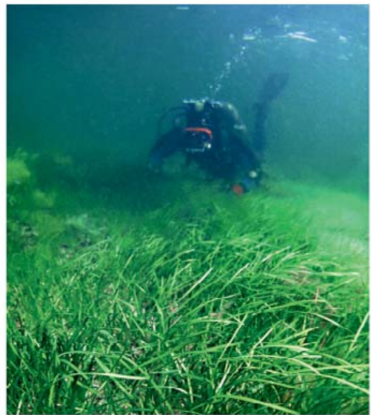
LANDSKRONAS MILJÖREDOVISNING 2012